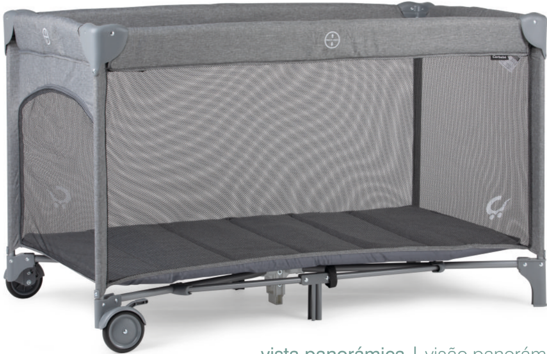
vista panorámica | visão panorâmica 360°

Disponibile en Gris (CZT) Disponível em Cinza (CZT)