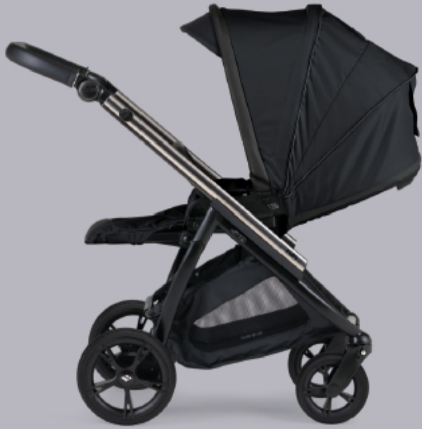
Cadeira representada com chassis Misto Cromado mate - Preto