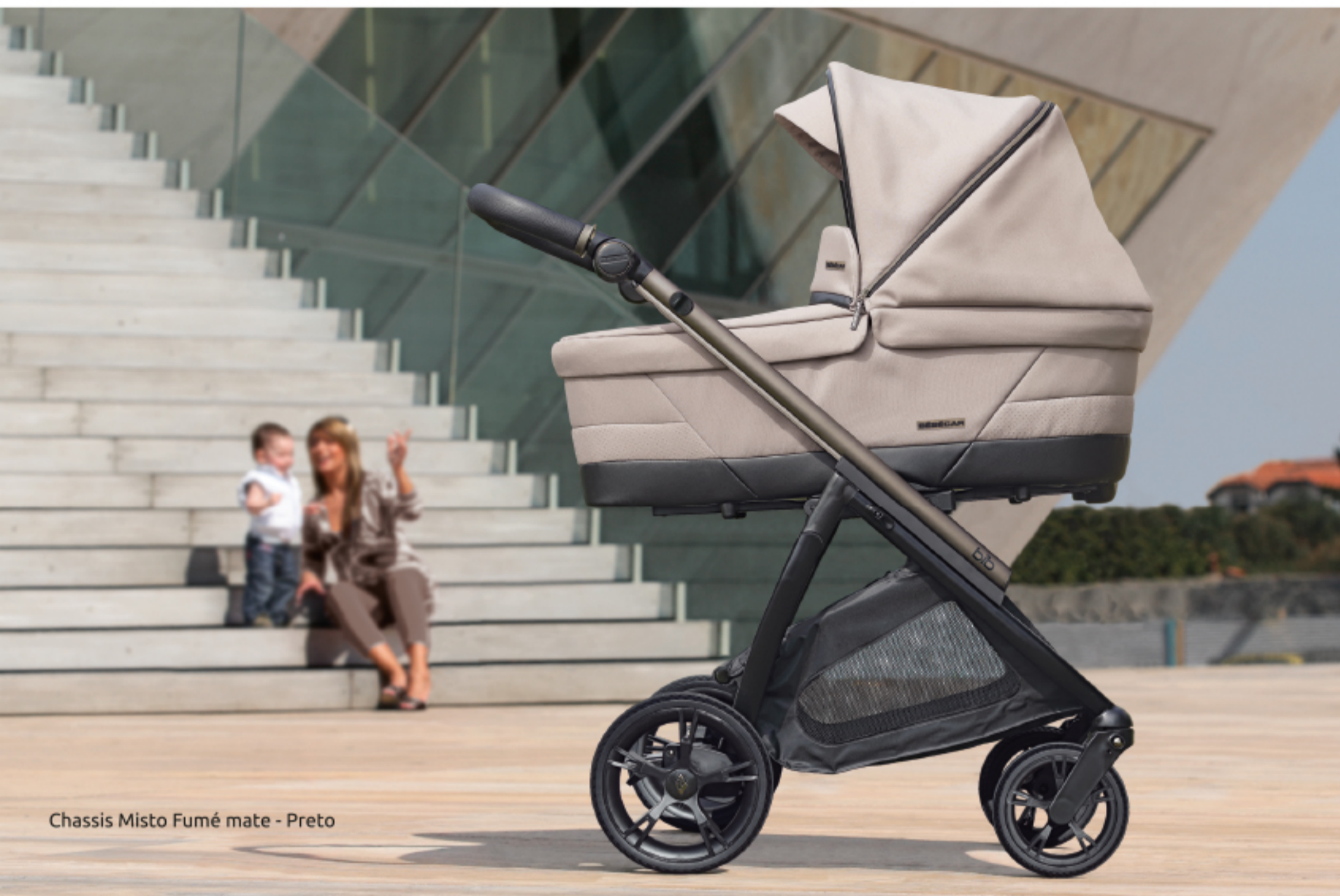
Chassis Misto Fumé mate - Preto