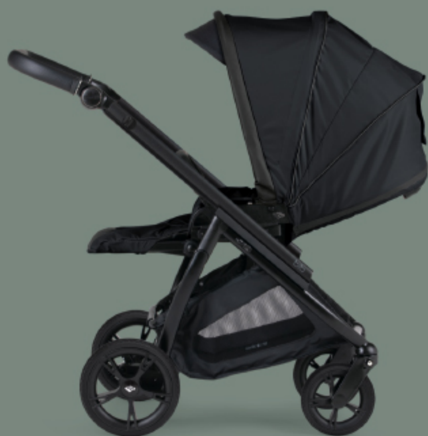
Cadeira representada com chassis Preto