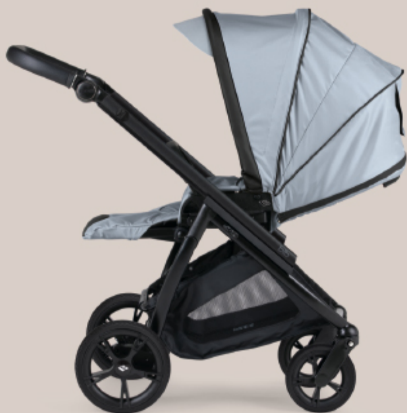
Cadeira representada com chassis Preto