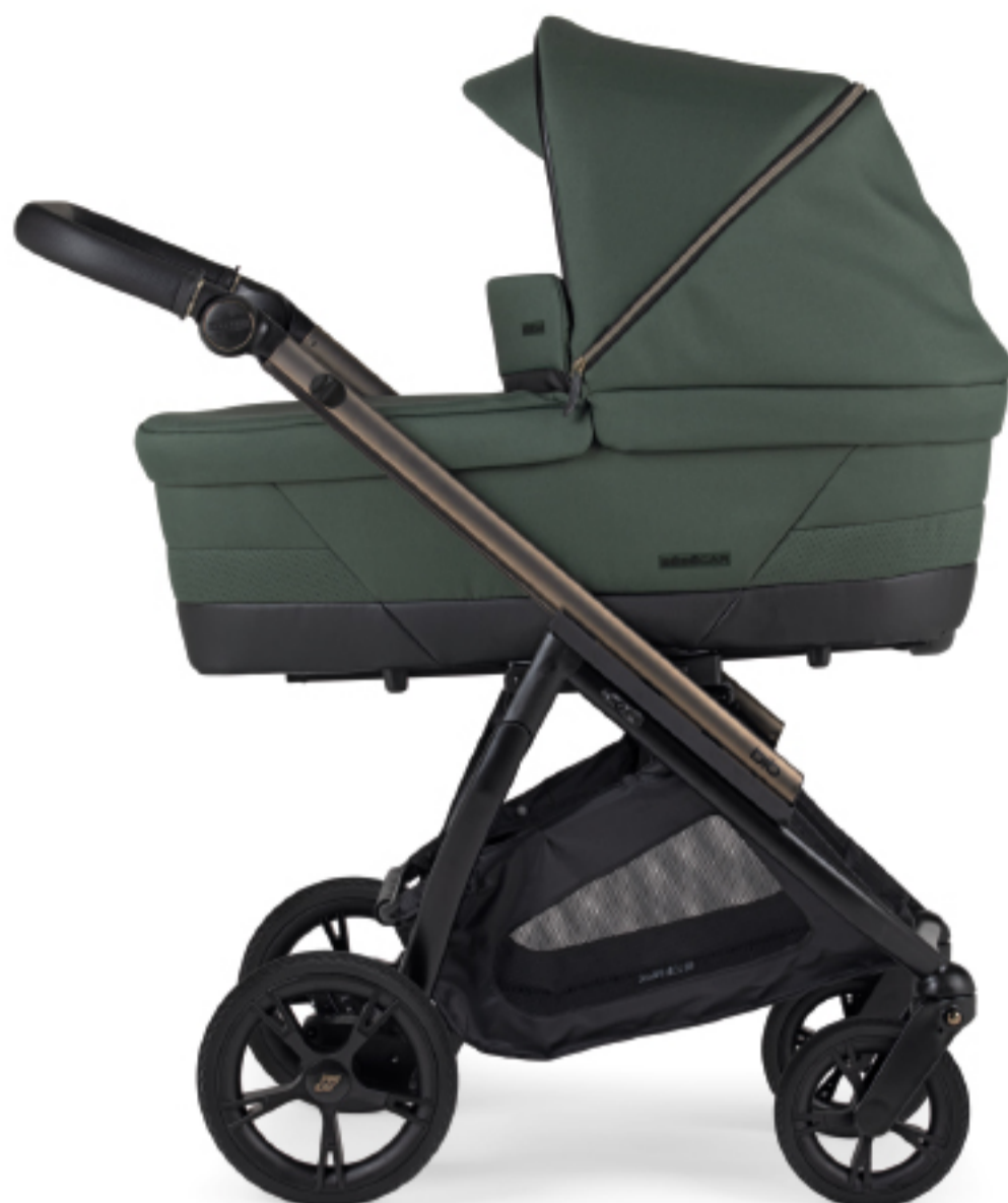
Chassis Misto Fumé mate - Preto