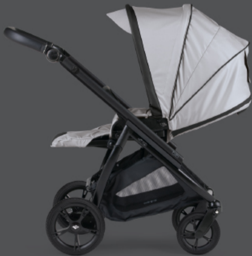
Cadeira representada com chassis Preto