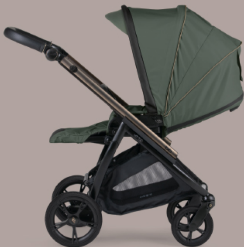
Cadeira representada com chassis Misto Fumé mate - Preto