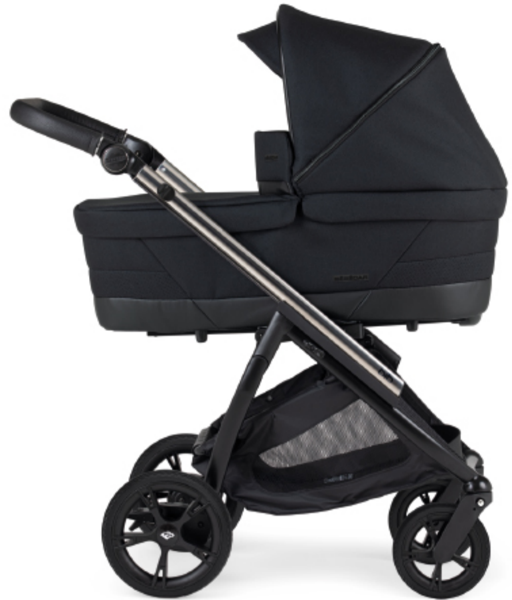
Chassis Misto Cromado mate - Preto