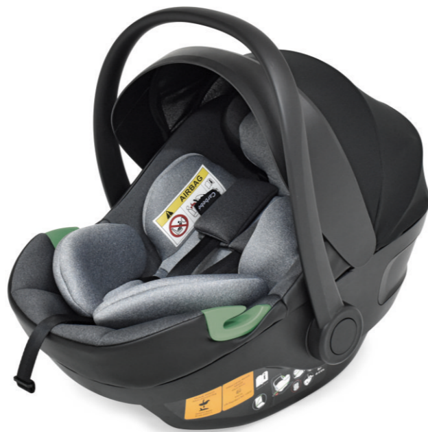
Negro - Gris | Preto - Cinza

La versión sin la base (ref.8686), se instala en el automóvil con los cinturones de seguridad de 3 puntos, del vehículo. A versão sem a base (ref.8686), instala-se no automóvel com os cintos de segurança de 3 pontos, do veículo.