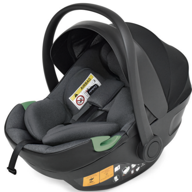
Negro | Preto